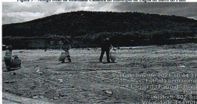
Figura 5 – Antigo lixão da localidade Canastra no município de Lagoa do Barro do Piauí

16 de nov de 2021 10:44:31 Estrada sem nome Lagoa do Barro do Piauí PIAUÍ Altitude: 502,3m Velocidade: 46km/h